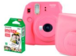
Câmeras Instantâneas Instax Mini 9 - 10x R$

Absurdo ainda bem que a justiça foi feita muito embora irreparável..muitos estabelecimentos agem assim impunimente