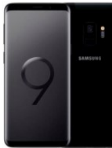
Smartphones Galaxy S9 128GB - 1 429,90