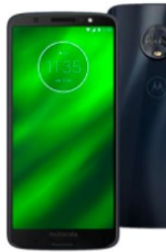
Smartphones Moto G6 Plus - 10x R$