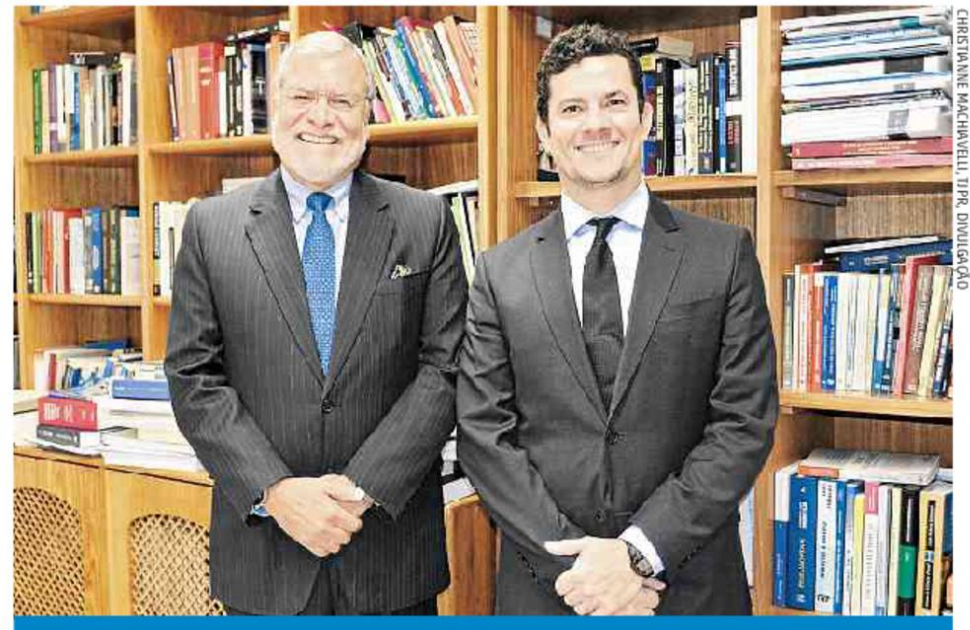
CHRISTIANE MACHAVELLI, TIPO, DIVULGAÇÃO

A Associação dos Juizes do Rio Grande do Sul (Ajuris) emitiu nota cobrando transparência do Executivo em relação aos incentivos fiscais. Os juizes, assim como os dirigentes dos principais sindicatos de servidores, sustentam que, em vez de focar na despesa, o governo deveria ser mais duro com os sonegadores e rever as renúncias fiscais, que somam R$ 15 bilhões.