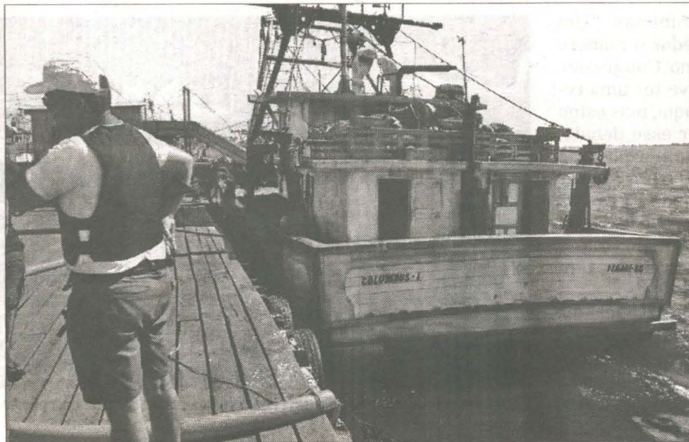
Embarcações foram autuadas por prática de pesca de arrasto dentro das três milhas da costa

Segundo a Patram, as duas embarcações estavam sendo monitoradas há alguns dias, em conjunto com PF e Ibama. A cada mestre dos barcos foi estabelecida uma fiança de R$ 8 mil.