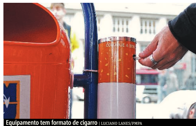
Equipamento tem formato de cigarro

A Prefeitura de Porto Alegre começou ontem a instalar as primeiras 39 bituqueiras junto às lixeiras. Tratam-se de cilindros em formato de cigarro para que fumantes depositem as pontas. É o projeto POA Sem Bituca, que começa pelo Centro Histórico e deve se estender pela cidade, totalizando 10 mil equipamentos. Os resíduos serão encaminhados para gerar energia na produção de cimento. METRO POA